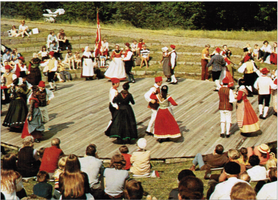
Foreningens opvisning på Frilandsmuseet, Lyngby i 1975. - I alt 26 dansere.