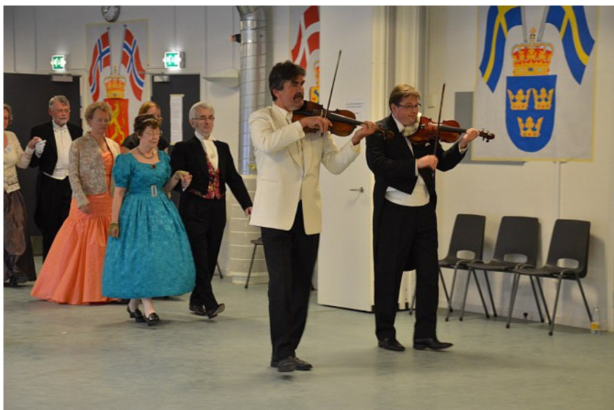
Hanslovs Orkester føre de danseglade gæster ind i salen

I 2012 afholdt Gladsaxe-Søborg folkedansere sammen med Gladsaxe Tangoforening og Gladsaxe Linedancers "Vild med Dans" et konkurrence koncept som i TV.